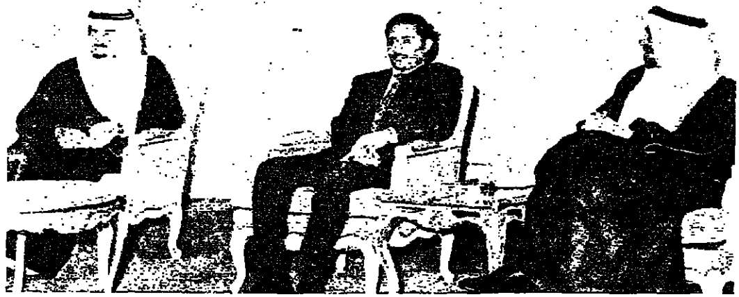
الملك خالد والوزير محمد بن عبد العزيز عبد الغني

تلقت صحيفة «واشنطن بوست» عن الرئيس اليمني ابراهيم الحمدي قوله ان بلاده سوف تنهي علاقاتها مع الاتحاد السوفياتي التي كانت تربطها بالاتحاد السوفياتي على مدى ٢٠ سنة، وتوسع بوجود مستشارين عسكريين فيها اذا امتدت صفقة الاسلحة الاميركية لهذه البلاد.